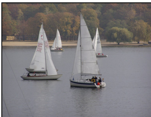
Unsere Sportster auf dem Wannsee.

Verschenken Sie doch einmal ein Bootswochenende zum Geburtstag oder fördern Sie die Praxis beim Führerscheinneuling mit einem „Motorboottag“.